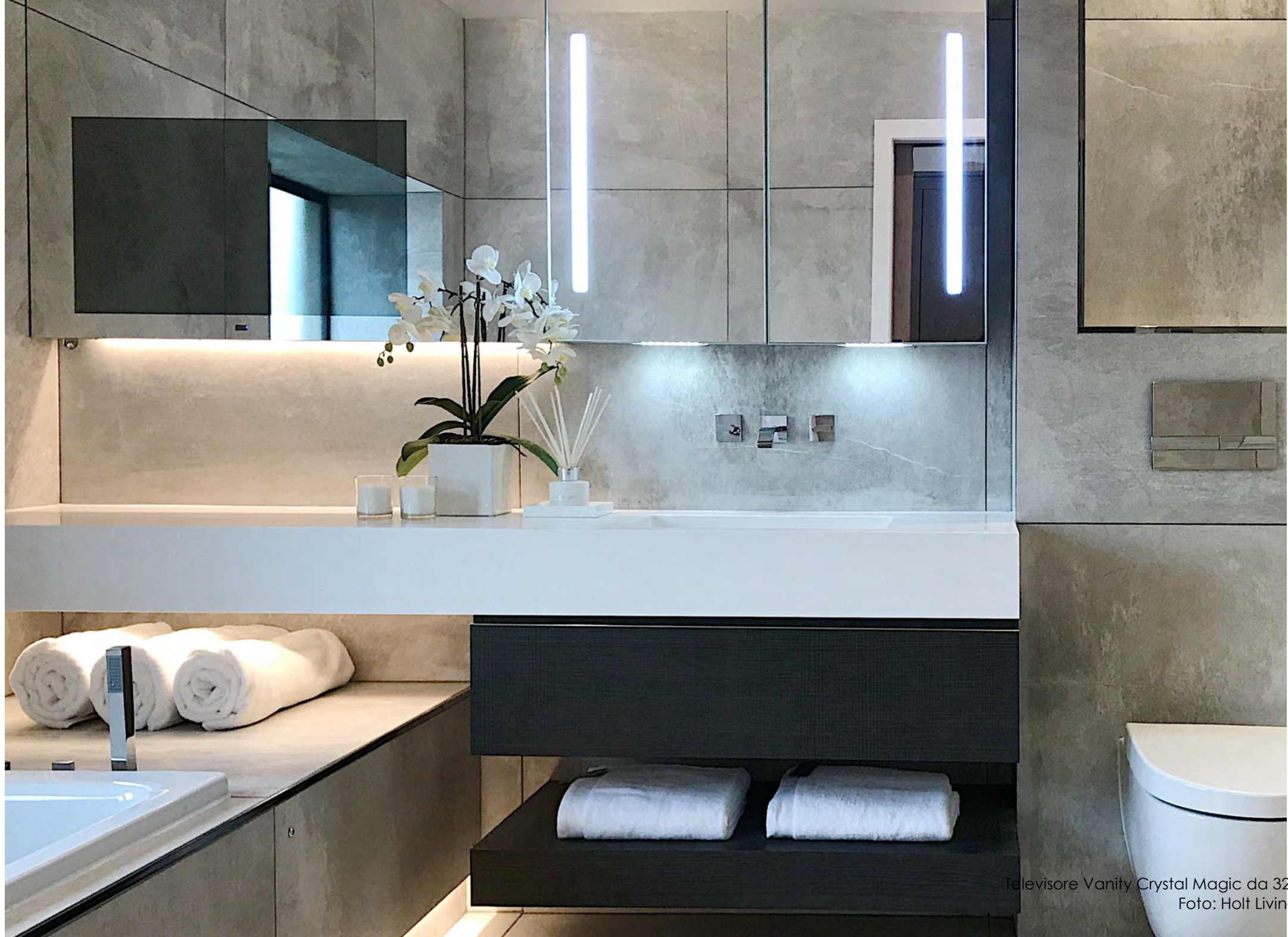
Televisore Vanity Crystal Magic da 32"