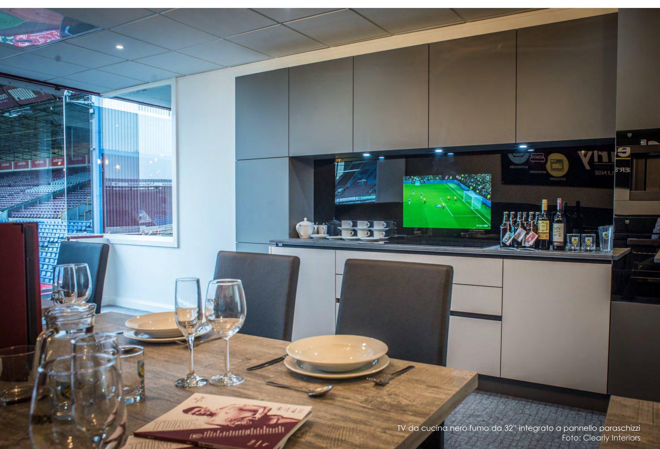
TV da cucina nero fumo da 32" integrato a pannello paraschizzi