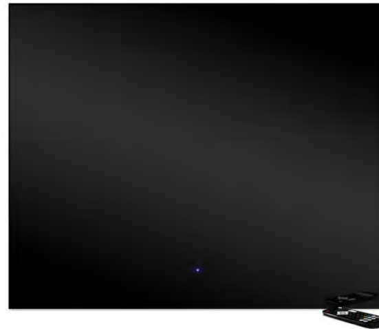
Televisore Trinity da 32" Versione Nero fumo Spento