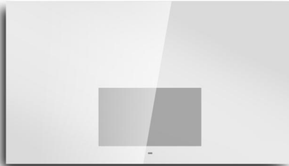
Crystal Magic – un normale specchio all'interno del quale resta visibile lo schermo scuro del televisore, anche da spento