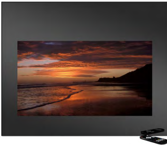
Televisore Trinity da 32" Versione Specchio scuro Acceso

I modelli Trinity sono disponibili nelle versioni Specchio scuro o Nero fumo, le tonalità perfette per garantire l'effetto "scomparsa" quando il televisore è spento.